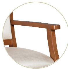
Sièges Massey - accoudoirs en bois.