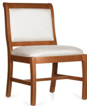
GC3796NA Chaise d'appoint Massey.

Les gamme Massey se distingue par un dossier rembourré de style encadré et des accoudoirs imbriqués à joue ouverte aux courbes douces d'un grand confort. Alors que les accoudoirs présentent un généreux profil offrant une bonne prise, aidant l'utilisateur à s'asseoir et à se relever, un bâti renforcé rehausse la robustesse et la durabilité des fauteuils et en fait un incontournable pour la salle familiale, la chambre de patients, les aires publiques, l'accueil ou le bureau, voire la salle à manger.