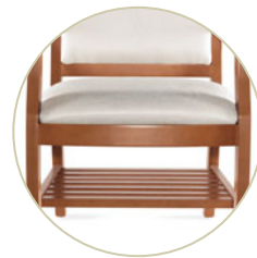
GC3796BR Fauteuil Massey avec tablette sous l'assise.