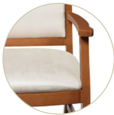
Sièges Massey - écart entre l'assise et le dossier.

Illustré en Smart Suede en grauu SM61 avec fini bois fruitier TFW. En couverture, illustré en New Dimensions en bronze antique ND15 avec fini bois fruitier TFW.