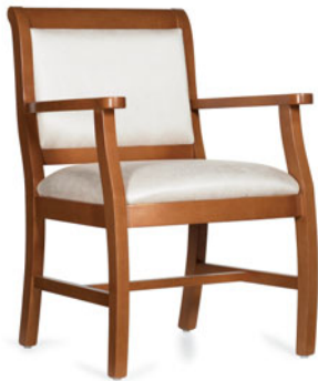
GC3796 Fauteuil Massey.