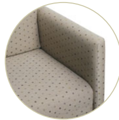
Sièges Heather - accoudoirs arrondis.