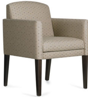
GC3771 Fauteuil club Heather à dossier bas.

L'élégance personnalisée, la gamme Heather saura attirer l'attention grâce à ses lignes franches et ses dimensions plus menues. Sa taille compacte l'avantage dans les espaces exigus, permettant une plus grande souplesse dans l'aménagement d'une pièce. D'élégants pieds effilés en bois dur ajoutent au charme de la gamme. Une housse munie d'une glissière en nylon enveloppe entièrement le coussin d'assise amovible et favorise un milieu sain et hygiénique. Le fauteuil Heather convient à merveille pour la salle de détente ou le hall d'entrée et trouvera sa place partout comme siège d'appoint.