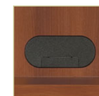
Gestion des câbles

Les portes des meubles sont munies de charnières de qualité commerciale qui permettent une ouverture complète sur 170° pour un accès sans entraves.