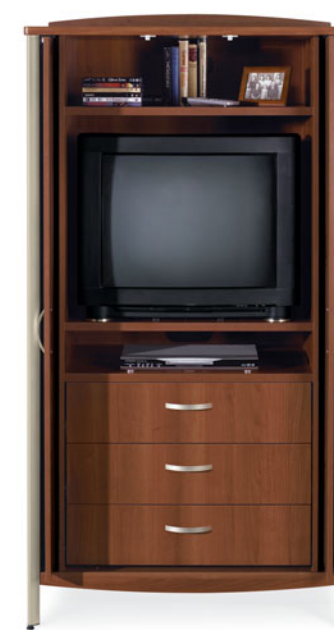
GCLTV03 (Portes ouvertes et escamotées)

Armoire média avec portes coulissantes escamotables, illustrée en miel Avant avec bandeau de profil arqué et poignées arquées.