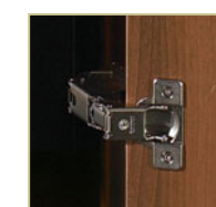
Charnières de qualité commerciale

Pour une plus grande sécurité, un jeu d'ancrage antibasculement est fortement recommandé.