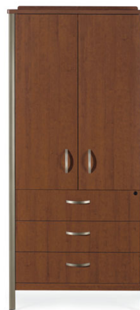
GCLTV02 (Portes fermées)

Des passe-câbles surdimensionnés permettent de passer facilement les fils et les câbles pour téléviseur, lecteur DVD et magnétoSCOPE.