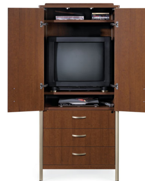
GCLTV02 (Portes ouvertes)

Armoire média avec portes à charnières, illustrée en cerisier Shaker avec bandeau de profil linéaire et poignées arquées.