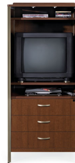
GCLTV01 (Sans portes)

Armoire média, illustrée en cerisier Shaker avec bandeau de profil linéaire et poignées arquées.