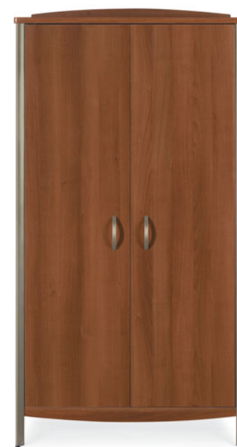
GCLTV03 (Portes fermées)

Le personnel d'entretien appréciera les passe-câbles surdimensionnés dans le panneau arrière qui permettent de passer sans tracas cordons d'alimentation et câbles de branchement. Une ouverture pleine largeur à l'arrière de la tablette du téléviseur et celle des appareils permettent de raccorder facilement les divers appareils. Des ouvertures dans la partie supérieure des deux côtés assurent une bonne aération et réduisent les risques de surchauffe des appareils.