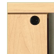
Serrures (en option)

Toutes les penderies sont munies d'une tringle en J assurant sécurité et tranquillité d'esprit.