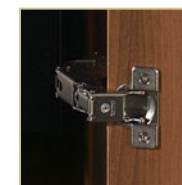
Charnières de qualité commerciale

Les rédacteurs de devis apprécieront la modularité des penderies Sonoma dont les dimensions correspondent à celles des commodes et des bibliothèques, ce qui permet de minimiser l'encombrement et de maximiser l'espace disponible dans les chambres. Tous les meubles présentent un dégagement au bas pour faciliter l'entretien et assurer un meilleur contrôle des infections. Un grand choix de finis et de profils rehausse le style recherché de la collection pour créer un environnement agréable et réconfortant. Des modules hors série sont possibles pour répondre aux exigences de projets adaptés à la culture propre à chaque établissement.