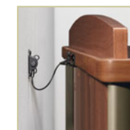
Jeu d'ancrage antibasculement

Les penderies sont munies d'un crochet de sécurité permettant de ranger des vêtements.