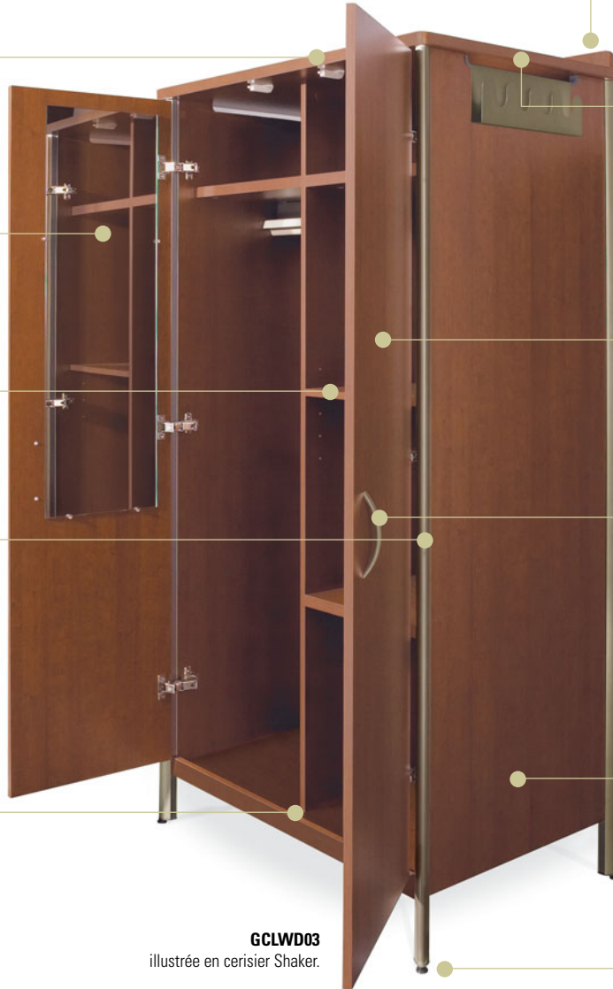
GCLWD03 illustrée en cerisier Shaker.

Une ouverture de drainage à l'avant au bas de la penderie permet au personnel d'entretien de se rendre compte rapidement des dégâts. Cette ouverture est recouverte d'un polymère durable facilitant le nettoyage. L'air qui circule entre l'ouverture de drainage et les ouvertures d'aération situées dans le haut favorise l'aération de la penderie.