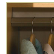
Tringle de sécurité pour vêtements

Les portes des meubles sont munies de charnières de qualité commerciale qui permettent une ouverture complète sur 170°.